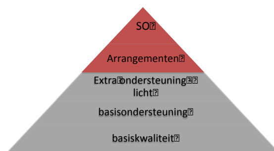
Figuur 2: Verantwoordelijkheidsverdeling

basisondersteuning, de extra ondersteuning – licht (arrangementen gefinancierd uit de middelen lichte ondersteuning) en voor de toeleiding tot speciaal basisonderwijs. Indien een leerling een arrangement nodig heeft dat gefinancierd wordt uit de middelen extra ondersteuning – zwaar of toe geleid moet worden naar het speciaal onderwijs, dan moet dat aangevraagd worden bij het SWV PO De Kempen (zie ook paragraaf 5: proces toeleiding tot extra ondersteuning). Figuur 2 brengt dit in beeld.