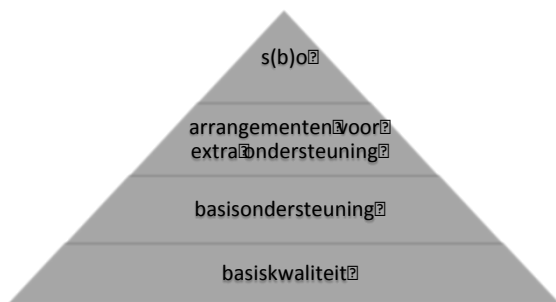
Figuur 1: Niveaus van ondersteuning

Passend onderwijs voor ieder kind dat woont in de Kempen wordt gerealiseerd door basiskwaliteit en basisondersteuning op alle 77 basisscholen, door passend arrangeren voor leerlingen op basisscholen die extra ondersteuning nodig hebben en, als het echt niet anders kan, toeleiding tot speciaal basisonderwijs of speciaal onderwijs. Zie figuur 1.